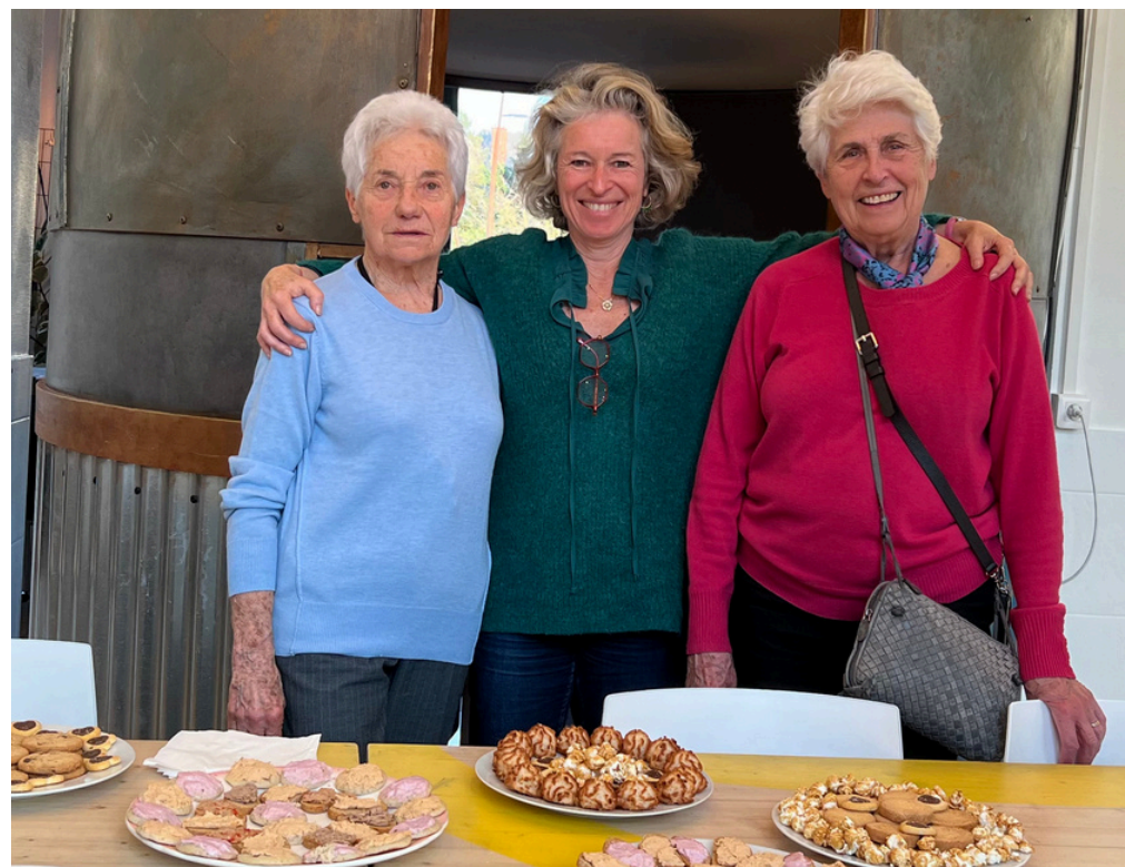
Préparation du buffet d'un événement