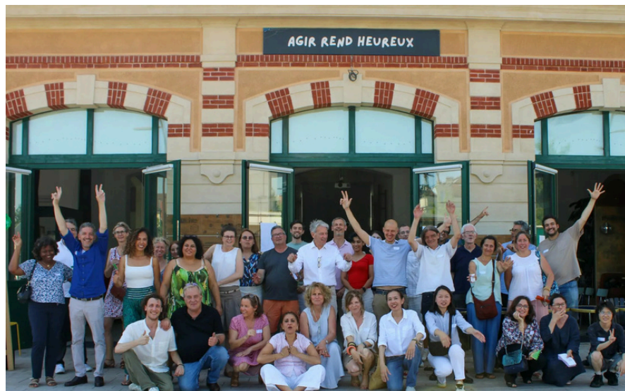
Journée de clôture de Coup d'Envoi mai 2025