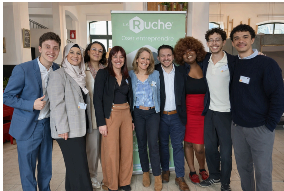
4ème promotion Bee Impacter

Anne Goulay, lauréate de la 3e promotion — coach professionnel