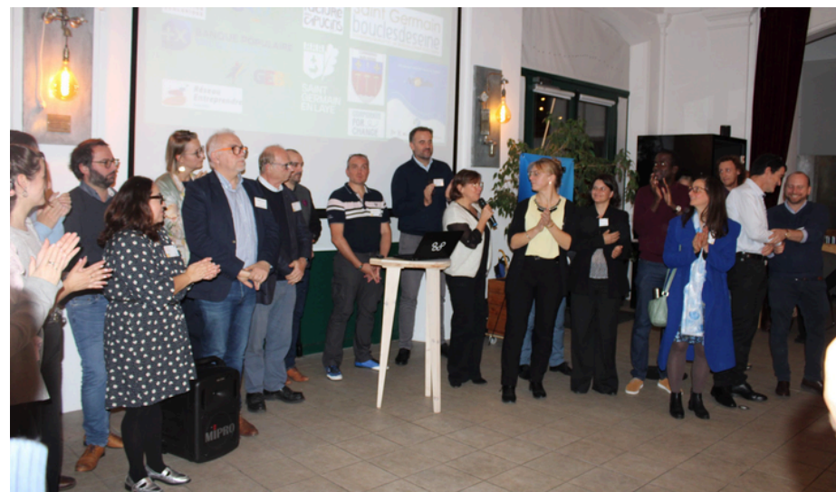
Soirée de lancement d'ACT'Yv