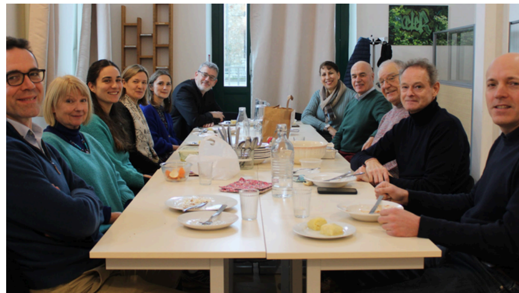
Déjeuner mensuel du Club Mentorat