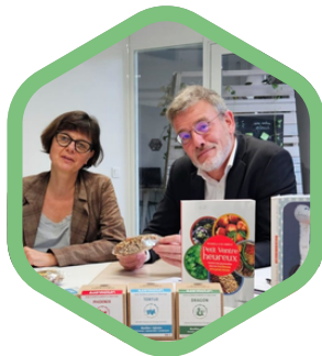
Mentorat et coaching