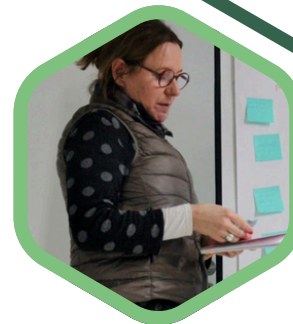
Ateliers d'intelligence collective

Je bénéficie aussi d'un accompagnement collectif